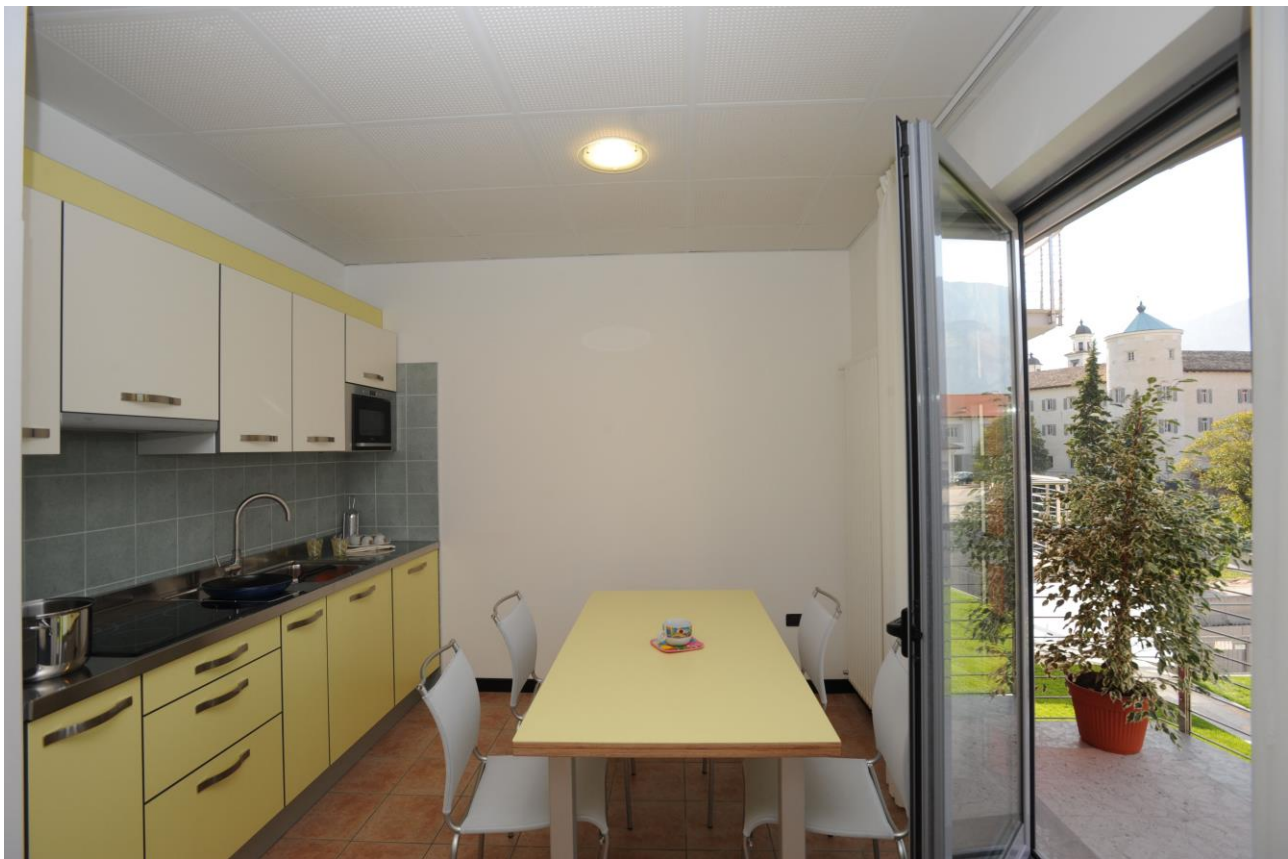
Fig. 5 | San Michele all'Adige, Fondazione Edmund Mach. Le residenze

Si stima che l'intero intervento avrà un costo di circa 5 milioni di euro che può essere suddiviso come di seguito: