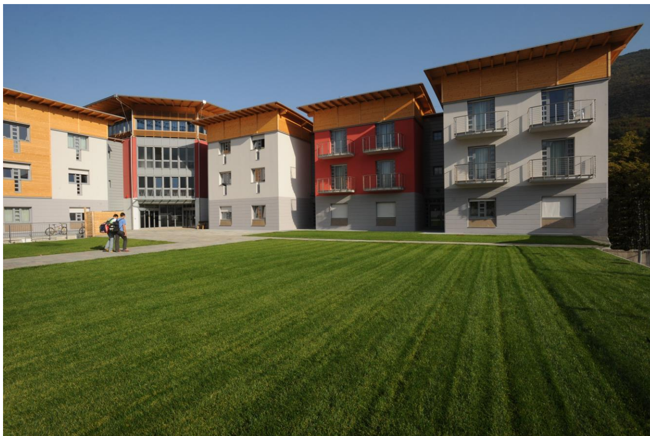
Fig. 2 | San Michele all'Adige, il campus della Fondazione Edmund Mach

L'ipotesi progettuale si basa sull'esperienza maturata con realizzazione nuovo campus di S. Michele all'Adige, in Trentino, e che ospita la sede della Fondazione Edmund Mach, uno dei soggetti capofila della rete che ha elaborato la presente proposta.