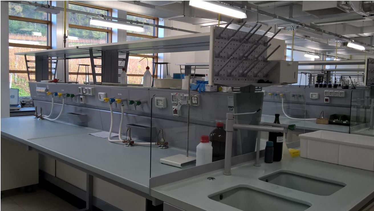
Fig. 4 | San Michele all'Adige, Fondazione Edmund Mach. I laboratori